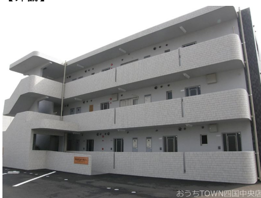
おうちTOWN四国中央店