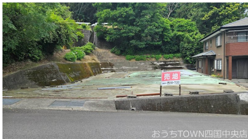
おうちTOWN四国中央店